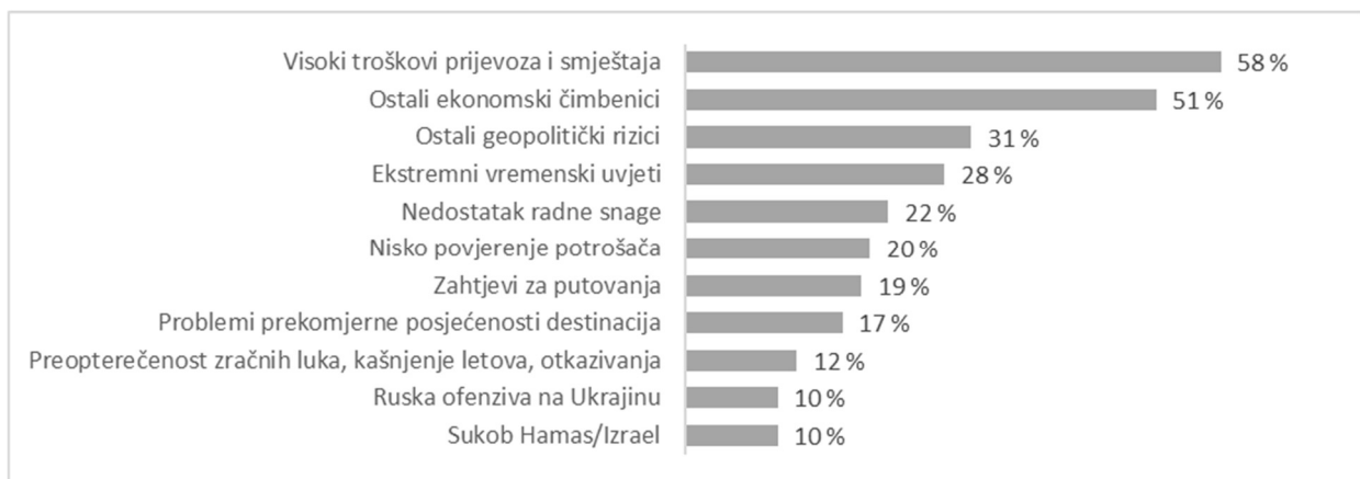
Slika 1. Glavni izazovi turizma u 2025. godini